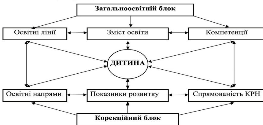
Рис. 1. Єдність загальноосвітніх і корекційно-розвивальних завдань спеціальної програми

Отже, реалізація принципу дитиноцентризму та взаємозв'язок загальноосвітнього і корекційного блоків програми можна представити у вигляді схеми (див. рис. 1).