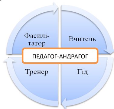
Рис.1. Рольові позиції педагога-андрагога

Можна розглянути інший підхід щодо ролей педагога-андрагога, які є взаємопов'язаними, взаємодоповнюваними і взаємозалежними, висвітлений у працях дослідників з Великобританії (рис. 1).